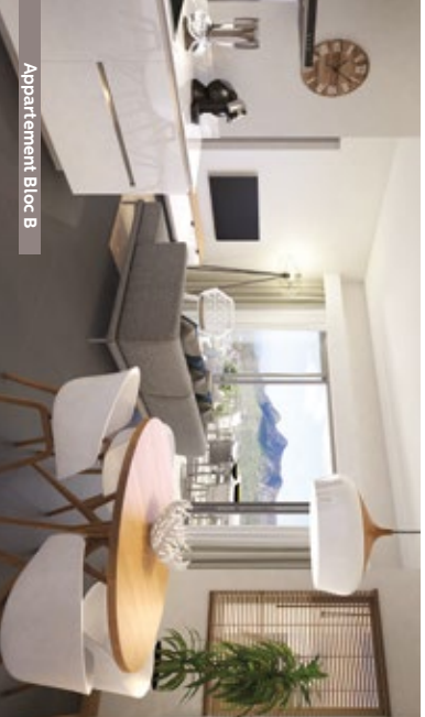
Appartement Bloc B

Forte de son héritage et de ses atouts naturels, cette région poursuit sa vision d'un développement planifié et harmonieux. Les Promenades d'Helvétia portent ainsi cette promesse d'authenticité et de modernité, d'une vie active sans compromis sur les loisirs, d'un chez-soi connecté aux autres... Bref, d'un style de vie smart.